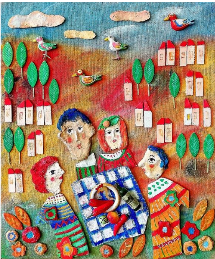
Poli Kanistra, Grécko

- do konca júla môžete hlasovať o víťazovi ceny verejnosti