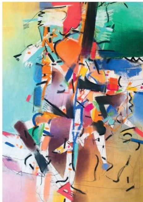
Chaos, 2018, 100 x 70 cm, pastel