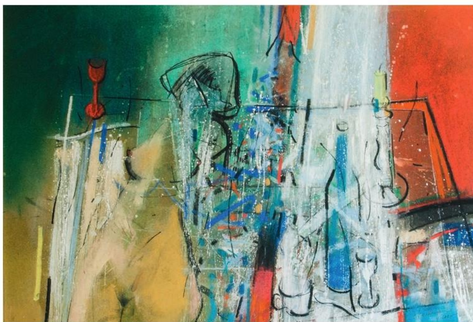
Červený štamperlík, 2005, 70 x 100 cm, pastel-akryl