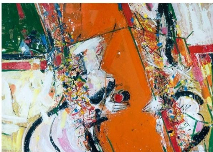
Mann und Frau, 2015, Acryl, 70 x 100 cm