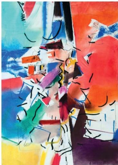
Keď letí anjel, 2018, 100 x 70 cm, pastel