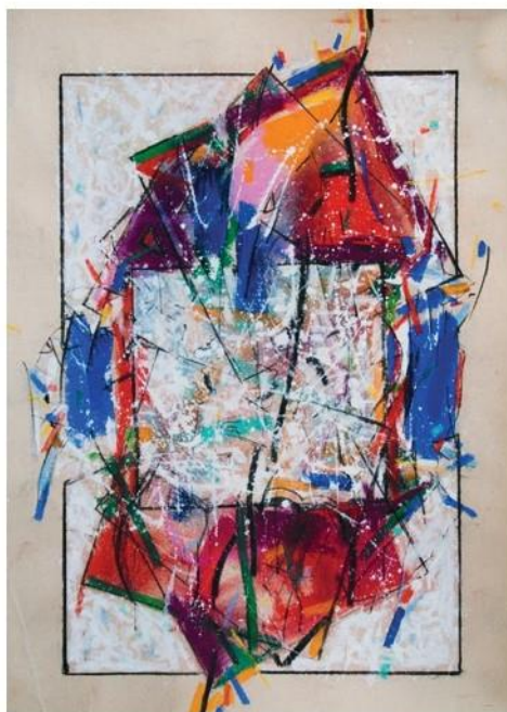
Tajné slovo, 2014, 70 x 50 cm, pastel-akryl