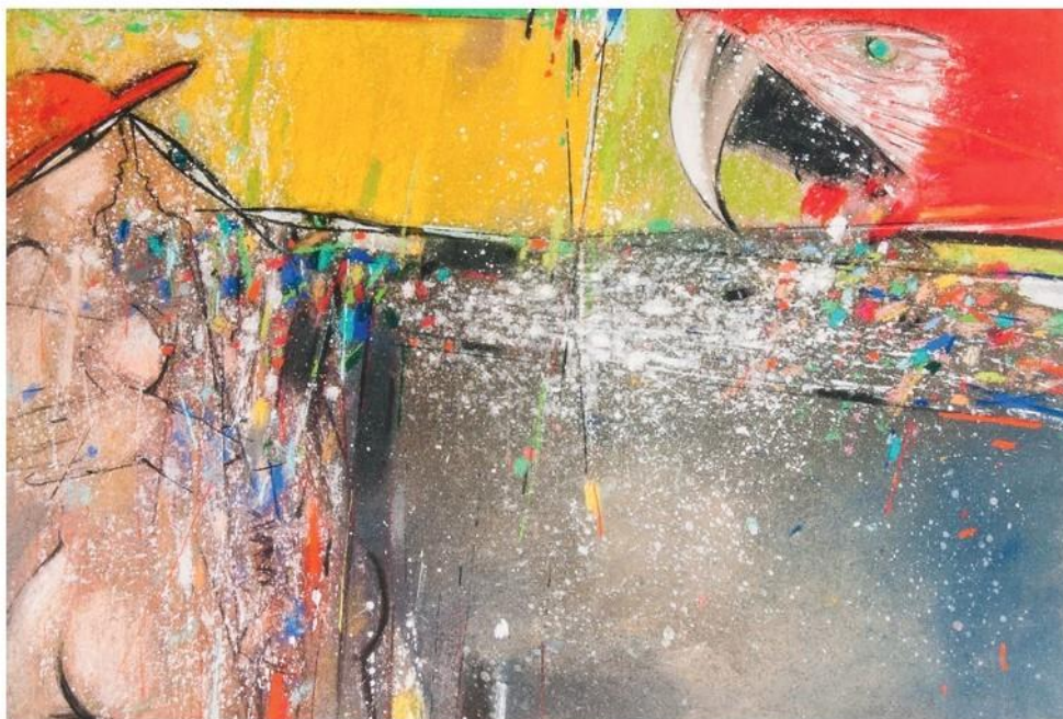
Zvedavý papagaj, 1998, 70 x 100 cm, pastel-akryl

Ak si neželáte zasielanie informácií, prosíme o krátku správu – ďakujeme.