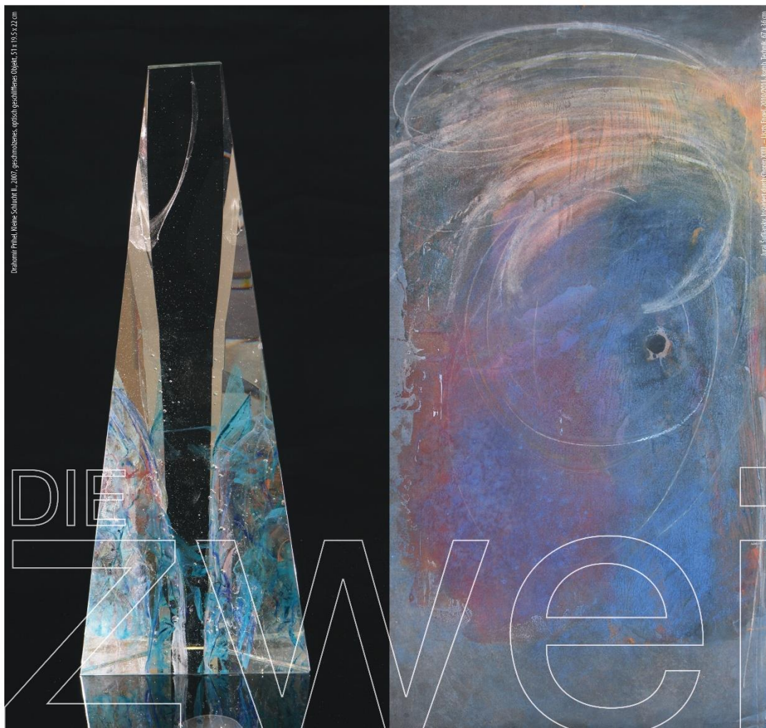
Daniela Prihel, Príhel, Schicht II , 2007, geometrisches, optisch gestelltes Objekt, 51 x 19 x 23 cm