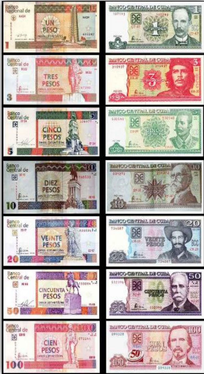
Na ľavej strane sú bankovky tzv. konvertibilného pesa. Na pravej strane sú platidlá tzv. národného pesa

Bezpečnostná situácia je na pomery Karibiku a Latinskej Ameriky stabilná, V poslednom čase však narastá počet krádeží a lúpežných prepadnutí a to aj v turistických lokalitách. Miestne médiá o takýchto prípadoch neinformujú. V takejto situácii, treba bezodkladne kontaktovať konzulárnu službu Zastupiteľského úradu SR v Havane ( GSM: +53 52 63 05 84 ) respektíve na informačné číslo MZVaEZ SR + 421 2 5978 5978 . Na narastajúcu kriminalitu veľvyslanectvo naposledy upozornilo v novembri 2016. (Viac informácií nájdete tu .)