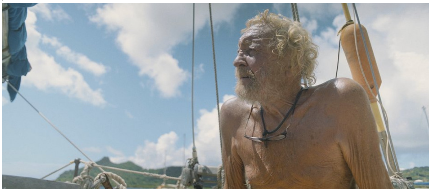
film The Sailor