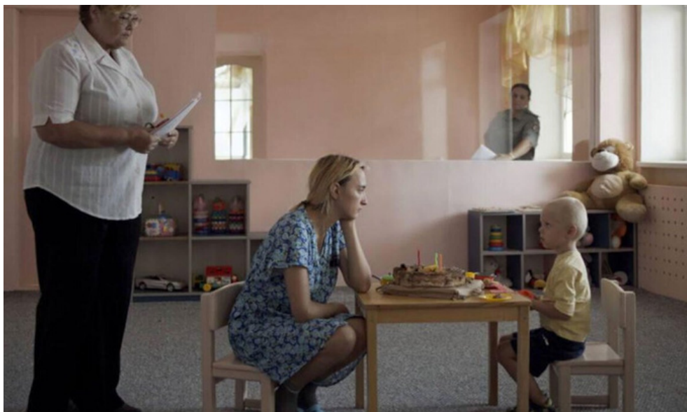
film 107 MATEK (CENZORKA)