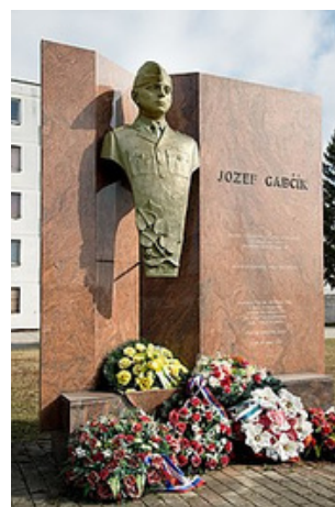
pomník Jozefa Gabčíka v Žiline