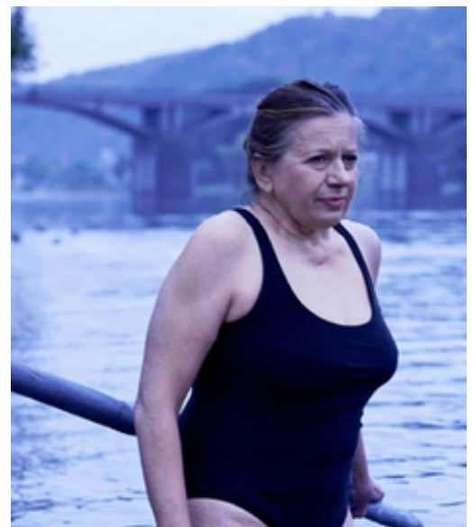
film Bába z ledu