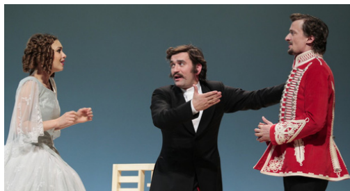
Zmierenie alebo Dobrodružstvo pri občinkoch