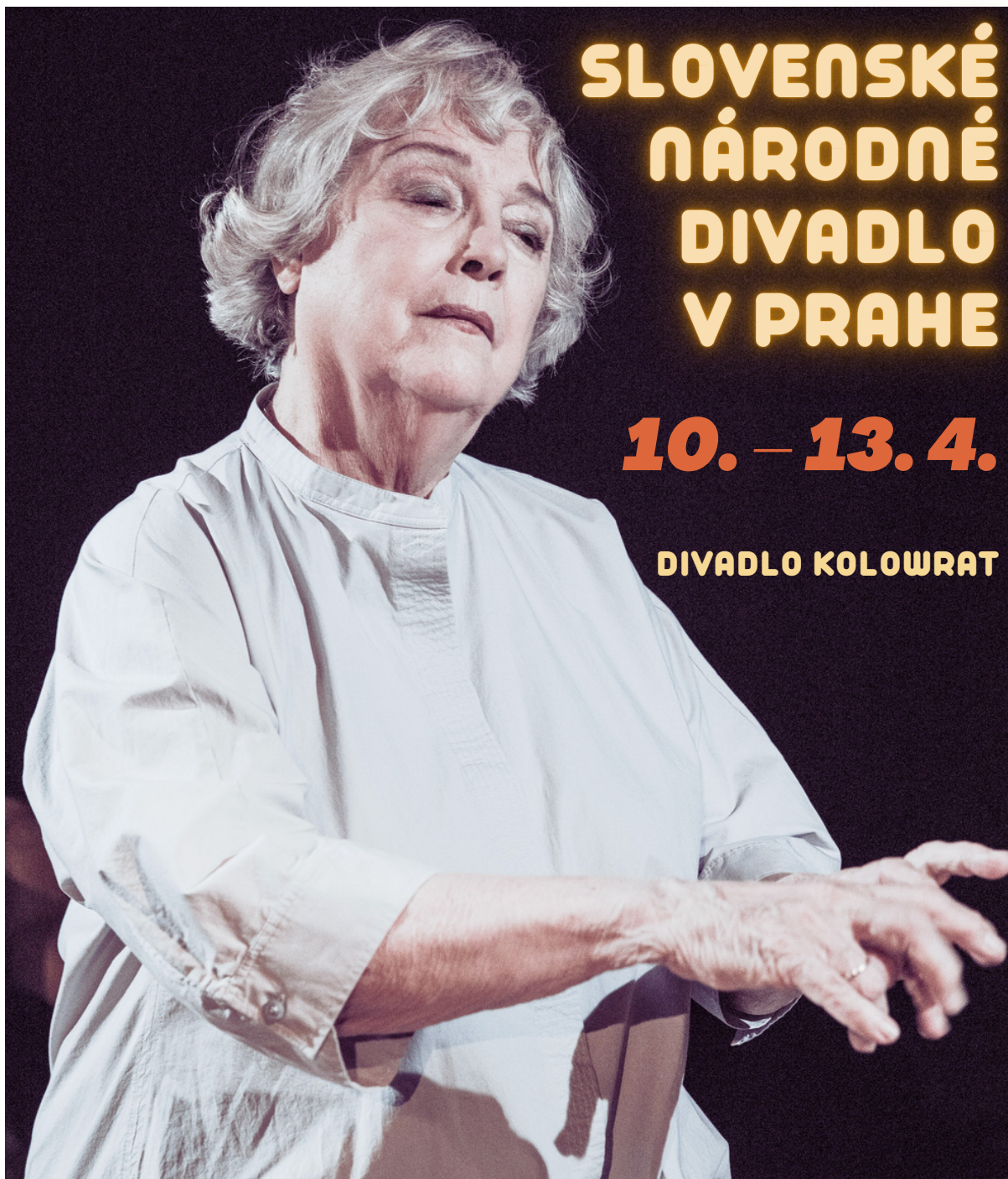
fotka z inscenácie Sova