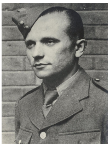
Jozef Gabčík 1912 – 1942

Narodil sa 8. 4. 1912 v obci Poluvsie (dnes mestská časť Rajeckých Teplíc). Zomrel 18. 6. 1942 (zastreliť sa pri prestrelke posledným nábojom), nakoľko v roku 2022 si tiež pripomíname jeho hrdinský čin, keď spolu s Janom Kubišom dňa 27. 5. 1942 vykonali atentát na zastupujúceho ríšskeho protektora Reinharda Heydricha v Prahe-Libni. Hoci počas 2. svetovej vojny už neboli občanmi Československa, predstavovali dvojicu špeciálne vycvičených česko - slovenských výsadcárov, ktorá sa svojím hrdinským činom vzoprela voči spoločnému nepriateľovi, ktorým bolo nacistické Nemecko.