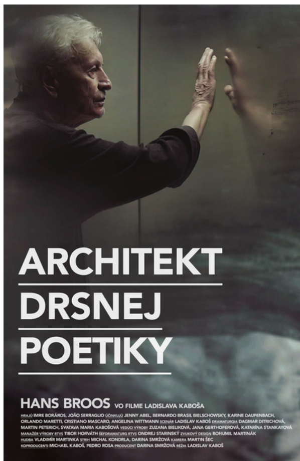
Architekt drsnej poetiky

Podrobnejšie informácie nájdete na: https://culture.hu/