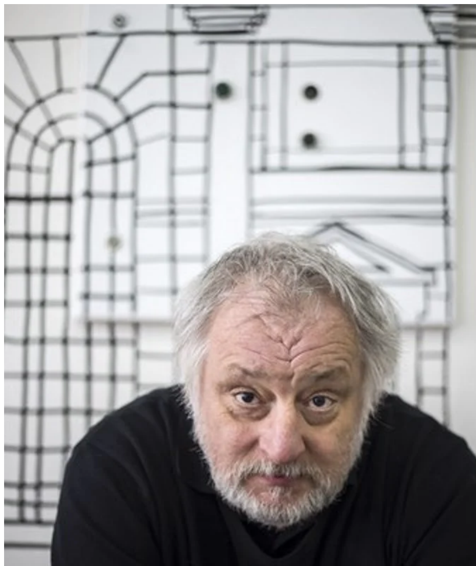
Režisér Martin Šulík