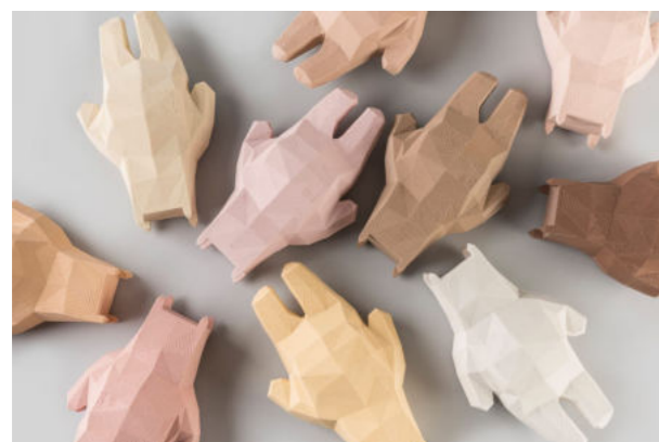
Silvia Sukopová - Lovasová: suveníry BaBear, 2013