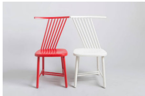
Ondrej Čverha: stoličky Šikmo, 1987