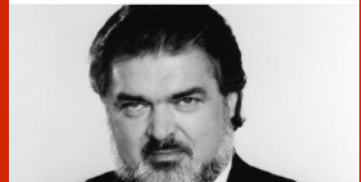
NAVŠTIVITEĽSKINA Peter Dvorský 70 | Navštevník Online Vedúca spevna agénda, tenorista Peter Dvorský, sa 25. septembra 2021 dočká významného dňa.

Slovenskí veľvyslanec v Chorvátsku / Slovacko veľposlanstvo u Hrvatskij Oslávená: 25. septembra o 19:30 Právnikovi svetovej opernej legendy, slovenského tenoristu Petra Dvorského pozývame vďaka nášmu meststvu narodeniny spoločne s nim. Mesto je dôležitým slovenským i medzinárodným významným a ocenil, reprezentoval slovenskú kultúru počas troch storočných lety a neskôr ako diplomat a riaditeľ Slovenského Hľadiska v Ríme. V dňoch jeho 70. narodenia, 25. septembra 2021 v dňoch medzi 19:00 a 20:40 sa Opera Slovenského národného divadla, uličného divokého opera Petra – Zobrať všet.