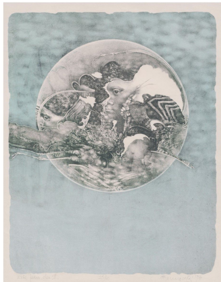
MISTRZOWIE SŁOWACKIEJ GRAFIKI