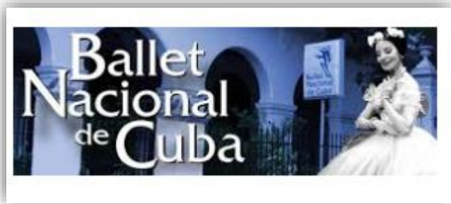
Kubánsky balet patrí medzi žiadané atrakcie zahraničných turistov

Kuba je nádhernou krajinou, ktorá je hudobná a tanečná veľmoc. Všetci cudzinci s dlhodobým pobytom na Kube (vrátane akademikov) môžu navštevovať kultúrne podujatia aj s platením v národnej mene. Odporúčanie slovenského veľvyslanectva sa týka najmä kvalitného baletu .