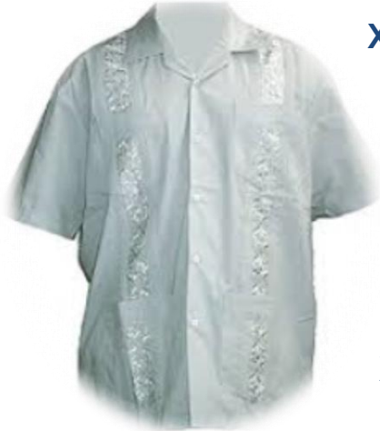
Tradičná košela tzv. guayabera, ktorú kubánski partneri hojne využívajú

Pri oficiálnych podujatiach kubánski partneri nevyžadujú v prípade oblečenia prísny protokol. Akceptujú ľahké letné košele (prípadne tradičnú kubánsku košelu tzv. guayabera) s pukovými nohavicami, u dám letnú eleganciu. Obleky sú hlavne v letných mesiacoch nepríjemnou záležitosťou.