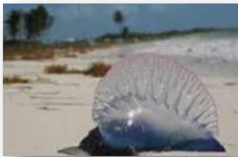
Tzv. aguamala sa zvykne volať aj "Barquito portugués" (portugalská lodička)

všeobecnosti však platí, že žiadny živočích na samotnom kubánskom súostroví nie je jedovatý. Výnimkou sú len niektoré morské živočíchy. Ide najmä o medúzy Physalia physalis , na Kube ľudovo prezývané „aguamala“. Kontakt s pokožkou si môže a nemusí (podľa alergickej reakcie) vyžadovať lekársku starostlivosť.