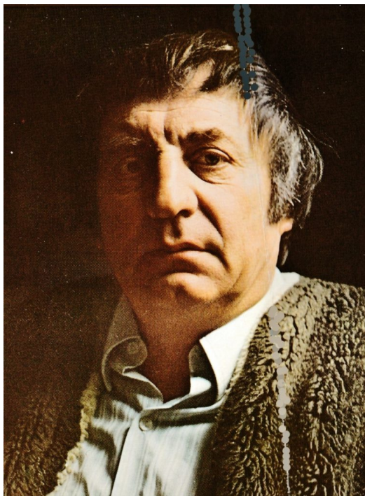
Karol Drexler

100. výročie narodenia Karola Drexlera, (18. 1. 1923 – 17. 7. 2001), slovenský grafik, dizajnér a maliar