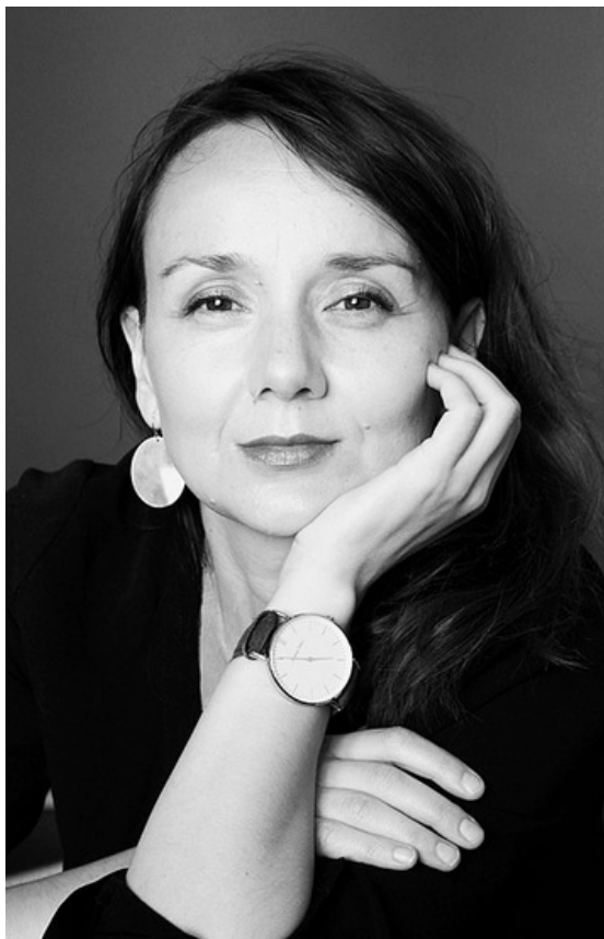
Katarína Kucbelová

27. a 28 . 9. 2023 | Muzeum umění Olomouc, Denisova 47, Olomouc