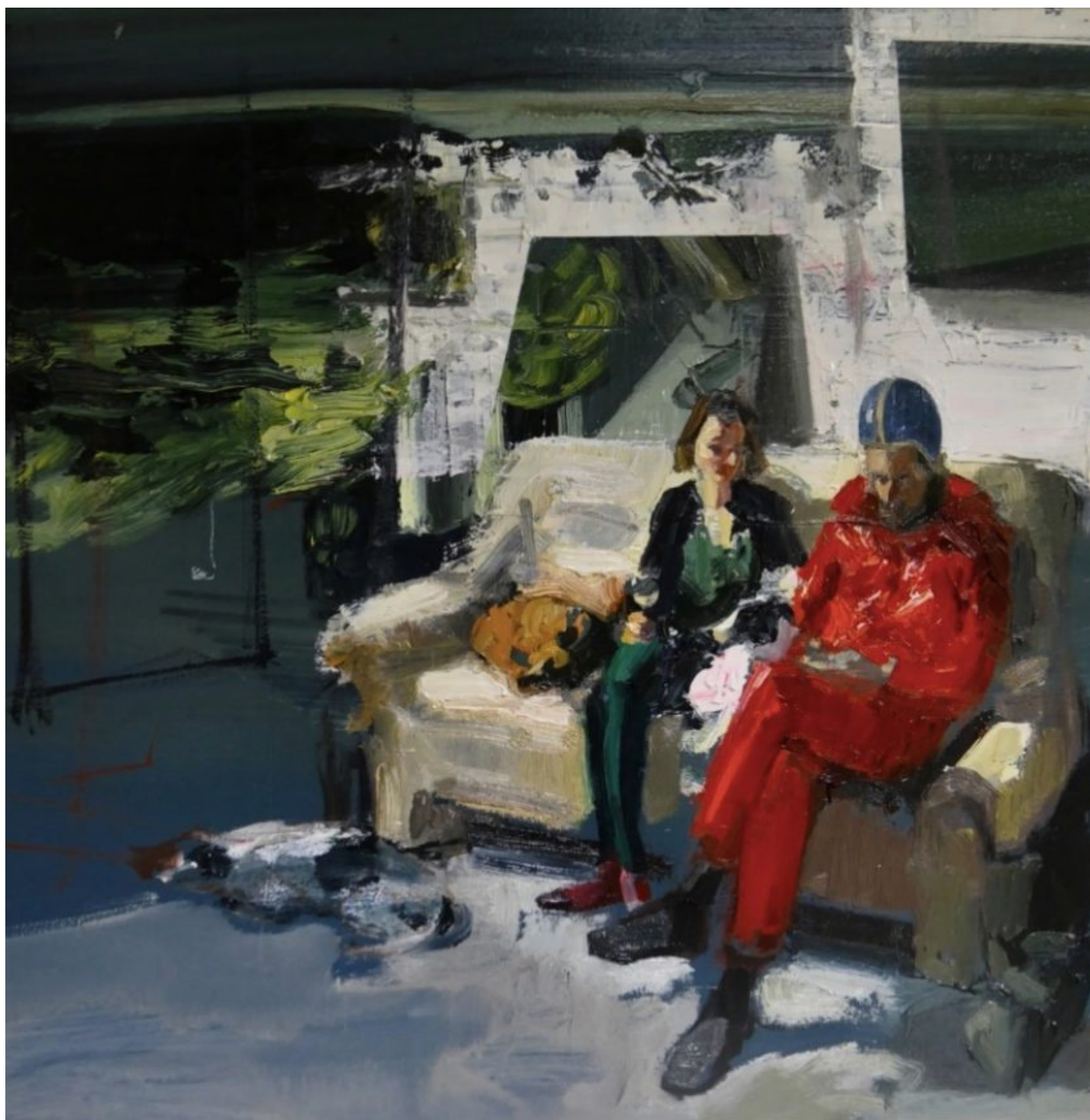
L'ŒUVRE « NÁVŠTEVA »