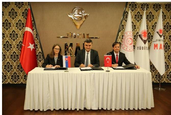
9. Spoločné vedecké fórum Slovenskej akadémie vied a Vedeckej a technologickej výskumnej rady Tureckej republiky (TÜBITAK).

V roku 2022 sa konalo v poradí 9. Spoločné vedecké fórum Slovenskej akadémie vied a Vedeckej a technologickej výskumnej rady Tureckej republiky (TÜBITAK) . Podujatie úspešne nadviazalo na už dekádu trvajúcu plodnú vzájomnú vedecko-výskumnú spoluprácu. Slovenská akadémia vied potvrdila záujem pokračovať v tejto spolupráci vyhlásením v poradí už 8. výzvy na podávanie spoločných bilaterálnych projektov SAV - TÜBITAK.