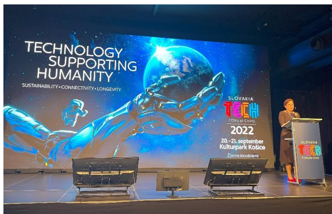
Medzinárodná technologická konferencia SlovakiaTech Košice 2022.

MZVEZ SR v roku 2022 pokračovalo v poukazovaní na príklady dobrej praxe, čím podporovalo expanziu slovenských inovácií do zahraničia. Robilo tak jednak v zahraničí, počas zahraničných ciest predstaviteľov rezortu, či prostredníctvom množstva podujatí a aktivít zastupiteľských úradov SR, ale aj doma na Slovensku. Príkladom sú tzv. Inovačné dni – návštevy zahraničných veľvyslancov akreditovaných v SR v slovenských inovatívnych firmách a vedecko-výskumných inštitúciách so silným medzinárodným potenciálom. Celkovo sme od septembra 2020 zorganizovali 27 takýchto podujatí, vrátane pravidelných návštev v regiónoch.