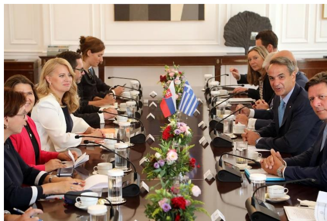
Prezidentka SR Zuzana Čaputová na oficiálnej návšteve Grécka.

Hospodársku a ekonomickú spoluprácu medzi Slovenskom a Gréckom posilnil podpis Memoranda o porozumení medzi vládnymi agentúrami pre podporu investícií a obchodu - SARIO a Enterprise Greece. Návšteva prehĺbila vzájomnú spoluprácu v oblasti lesného hospodárstva a vodozádržných opatrení a zintenzívnila zdieľanie skúseností v procese spravodlivej transformácie uhoľných regiónov.