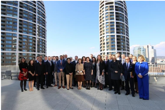
Na 20. Inovačnom dni sa predstavila Slovenská aliancia pre inovatívnu ekonomiku (SAPIE) a jej členská firma Vacuum Group.

republike predstavilo 16 úspešných inovatívnych slovenských firiem vrátane výskumných inštitúcií so silným medzinárodným potenciálom.