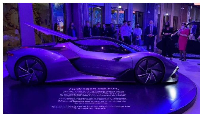
Expozícia v pavilóne Slovenska na EXPO 2020 v Dubaji.

Aktivity ekonomickej diplomacie boli v regióne Blížkeho východu primárne zamerané na prípravu, realizáciu a úspešnú prezentáciu Slovenskej republiky počas svetovej výstavy EXPO 2020 v Dubaji (od 1.októbra 2021 do 31. apríla 2022).