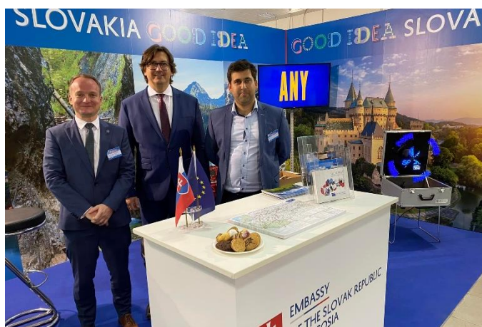
Turistický veľtrh TAXIDI 2022 na Cypre.

Na Cyprus smerovala podnikateľská misia 13 slovenských spoločností, ktoré sa zúčastnili na prezentačnom podujatí v rámci inovačnej konferencie ReflectFest 2022. Slovensko, ako turisticky atraktívna destinácia bolo prezentované na turistickom veľtrhu TAXIDI 2022. Išlo o historicky prvú účasť Slovenska na tomto podujatí, prostredníctvom ktorej sa Slovenskej asociácii cestovných kancelárií a cestovných agentúr (SACKA) podarilo úspešne rozšíriť svoju pôsobnosť na cyperskom trhu.