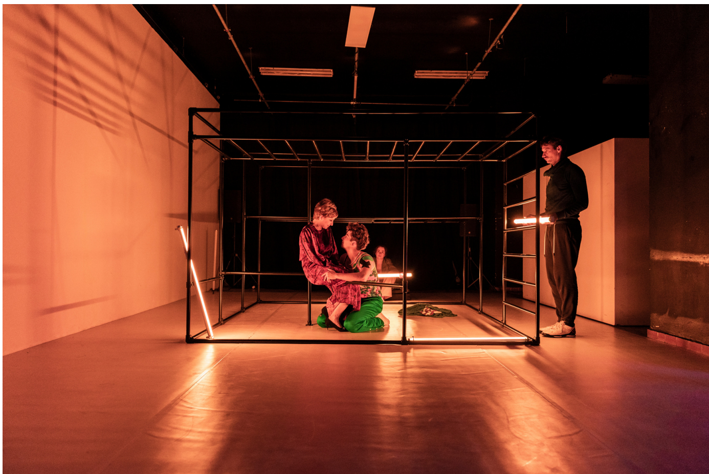
Predstavenie Nikdy Navždy

Hostovanie slovenskej inscenácie pri príležitosti tohtoročného slávnostného udeľovania prestížnej českej divadelnej ceny sa uskutočňuje v rámci programov k 30. výročiu vzniku Slovenskej republiky a k 30. výročiu vzniku Českej republiky.