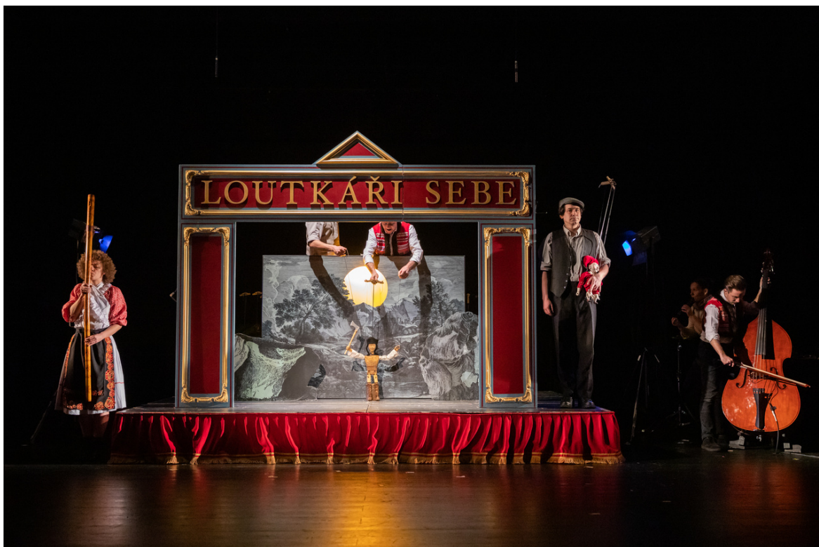
Zbojník a Gašparko

Inscenátori prehľadali fundusy, archívy a múzeá na oboch stranách rieky Moravy, usporiadali verejné zbierky a výsledok všetkého tohto úsilia nám teraz predkladajú. Nuž, dámy a páni, registrovaný zväz českých a slovenských bábkarov predstavuje tradičnú česko – slovenskú bábkovú hru.