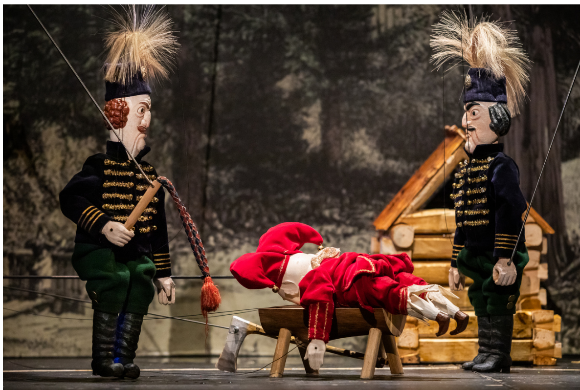
Zbojník a Gašparko