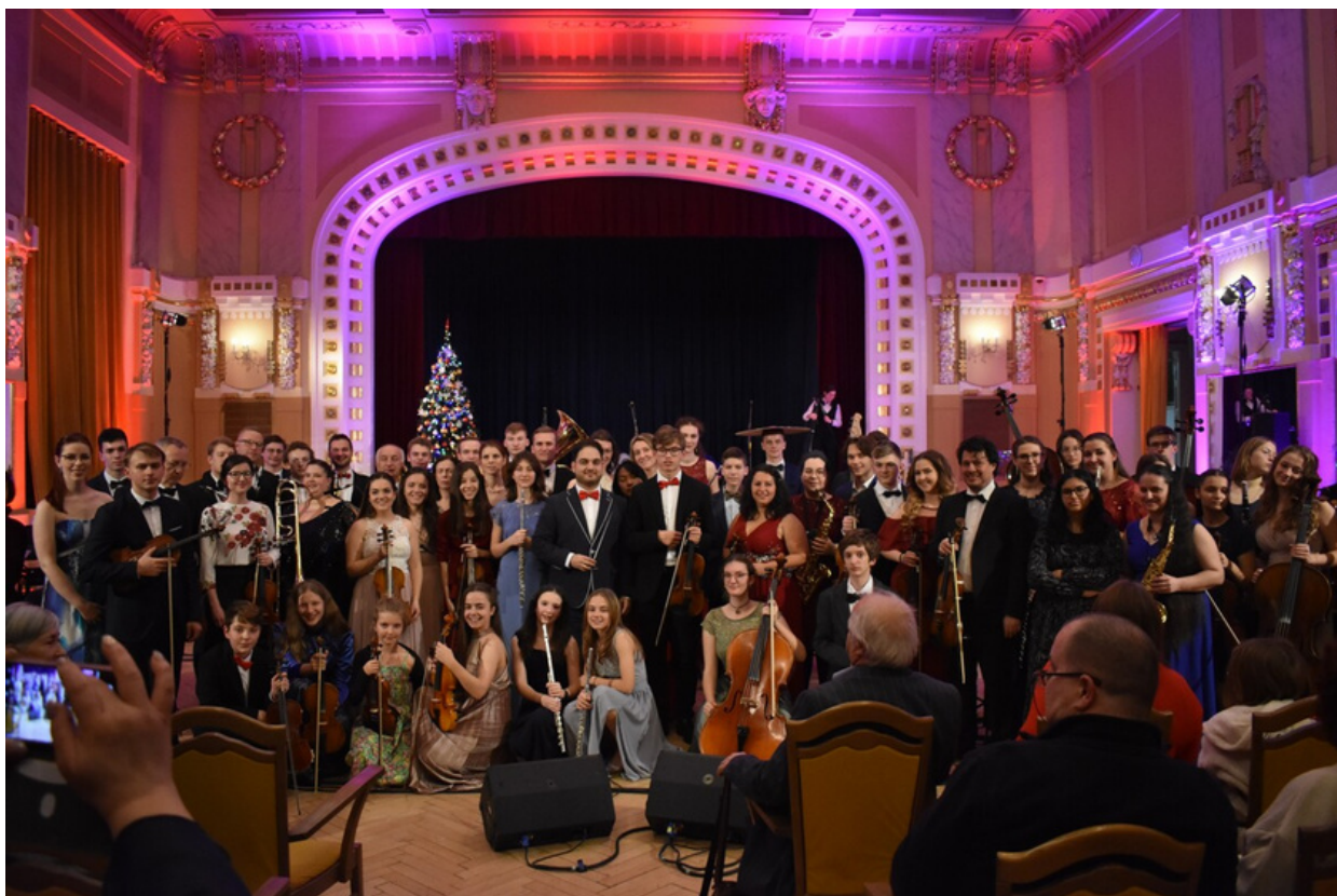
ORCHESTRA DOMINANTA

Z Bratislavy prichádza nové teleso, zložené z mladých hudobníkov, ktorých spája vášeň pre hudbu a spoločné muzicírovanie. Šestdesiatčlenný orchester sa po odohraní desiatok koncertov na Slovensku predstavuje v Prahe prvý raz.