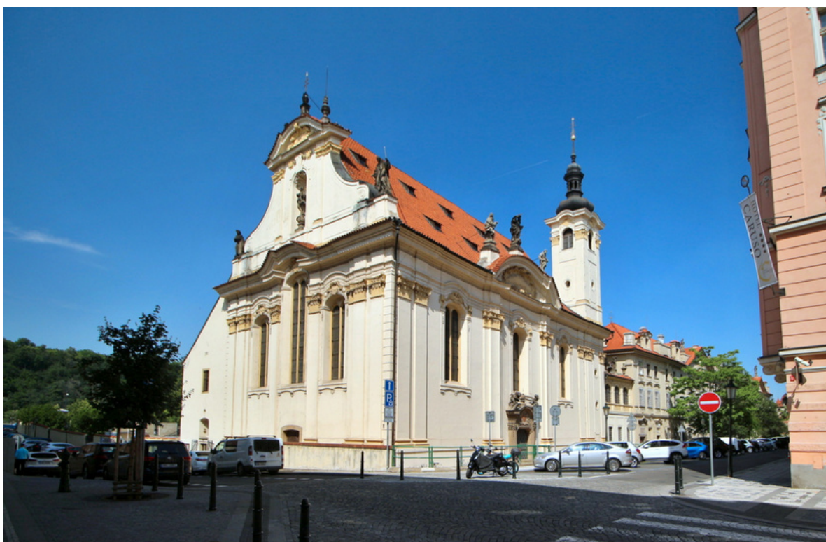
Kostel svätého Šimona a Judy

Podrobné informácie a vstupenky nájdete na tomto linku .