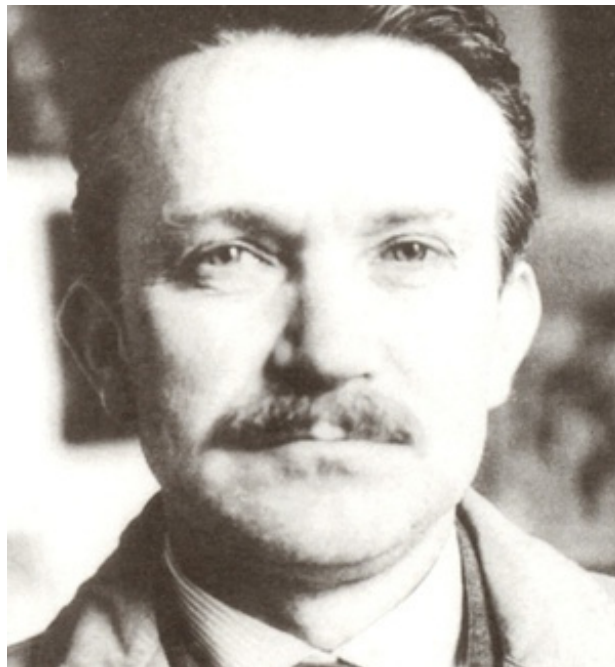
Peter Matejka