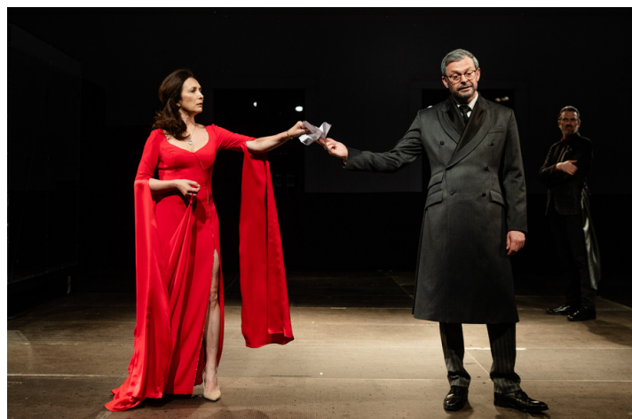
Predstavenie Hamlet

Hamletov príbeh sa vždy odvíja rovnako a predsa len inak. Každý, kto k jednému z najslávnejších textov Shakespeara pristupuje, zanechá v ňom niečo zo seba samého.