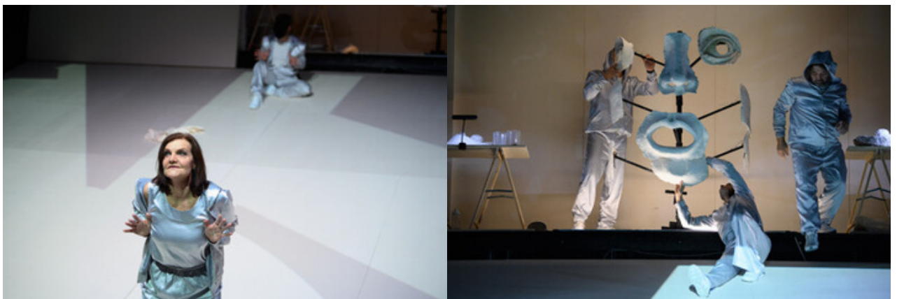
Divadelná inscenácia Iokasté

Predstavenie trvá 65 minút. Podrobnejšie informácie a vstupenky nájdete na tomto odkaze .