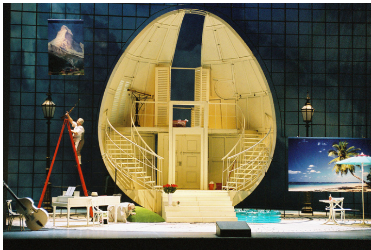
Gioacchino Rossini: Lazebník sevillský. Státní opera Praha, 2005

5. 10. 2023 o 17:00 | Městská knihovna v Praze (klubovna), Mariánské náměstí 1, Praha 1