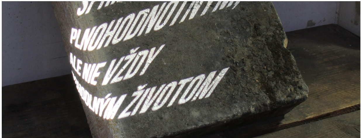
Kurátor výstavy a autor fotografie: Dušan Zahoranský

10. 10. 2023 – 3. 11. 2023 | Slovenský inštitút v Prahe, Hybernská 1, Praha