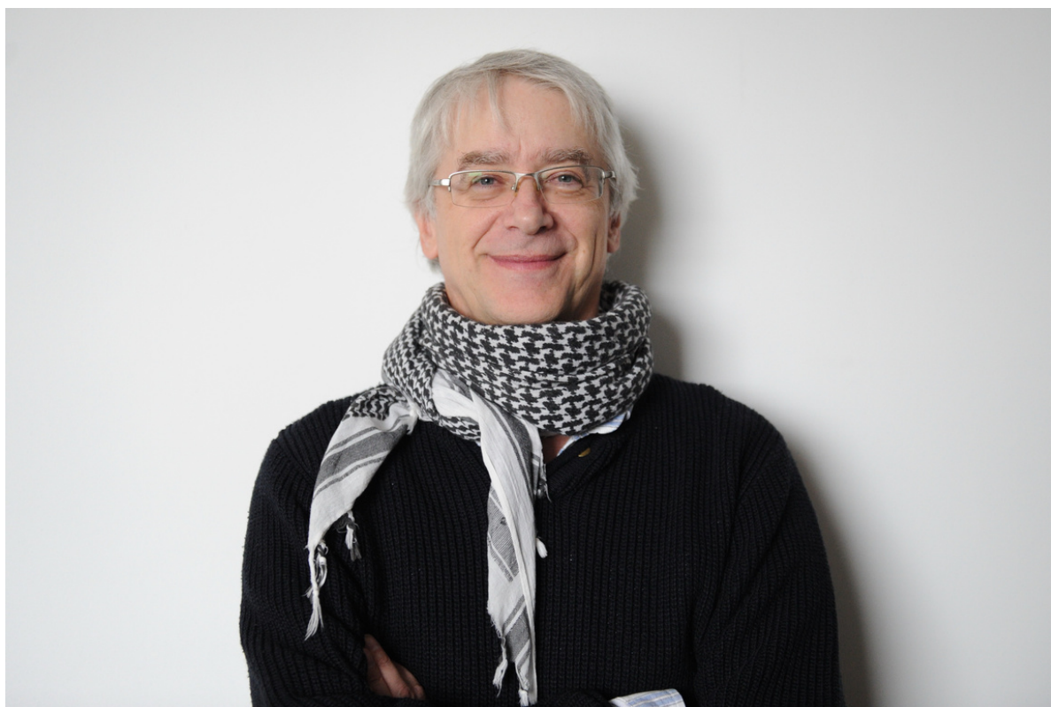
Režisér Martin Bendik