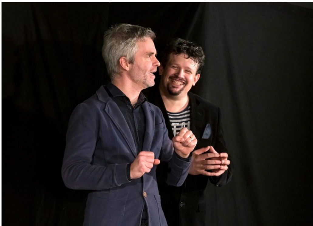
Predstavenie Štvrtá tretina

6. 10. 2023 | Divadlo Kalich, Jungmannova 9, Praha