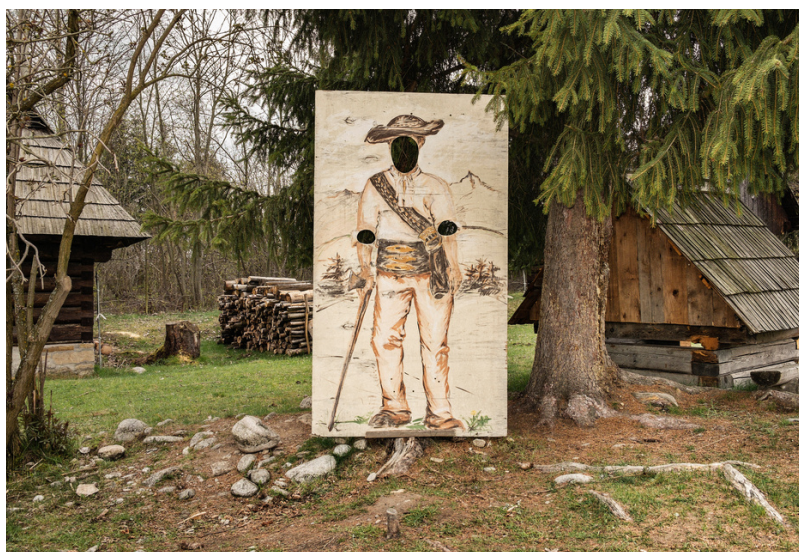
PRIBYLINA 2014

16. 11. 2023 – 20. 12. 2023 | Slovenský inštitút v Prahe, Hybernská 1