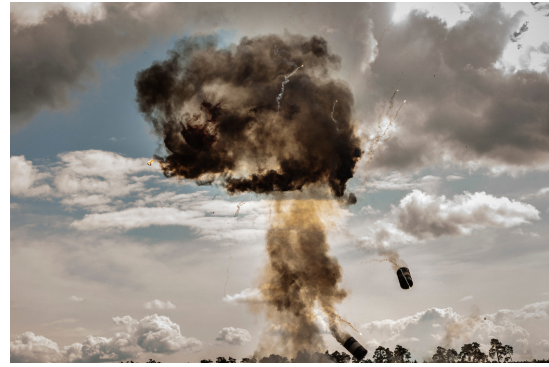
Zlava SENEK 2014: a SAHARA 2014

Pre pochopenie autorových diel musíme ako kľúč zvoliť paradox. Keď Aurel Hrabušický píše o Borisovej metóde ako o ceste, ktorá hovorí „jasne a presvedčivo“, musíme zároveň dodať, že týmto spôsobom rozpráva o nejasnom, o neviditeľnom, o tajomnom. Prekonáva tým obmedzenia lokálne, je jedno, či sú jeho snímky z hlavného mesta Bratislavy alebo z takmer anonymnej dediny niekde na východnom Slovensku. Ale aj obmedzenia časové, pretože nehrá rolu, či je z konkrétneho volebného roku, v ktorom zvíťazila tá či oná politická strana a nie je podstatné, či sa práve dostavala alebo nie ďalšia jadrová elektrárňa. V jeho obraze je identita ťažko uchopiteľná, je postavená na mozaike rozporov, ktoré spája jediné – vitalita. Akoby sa za všetkým, čo Boris Németh objavuje na Slovensku, skrývalo presvedčenie, že koniec nikdy nepríde. Tento zostup do hĺbín, aj keď s dobovými znakmi, pripomína čosi z mágie, je to kúzlenie, ktoré ťaží zo sily mnohoznačných vizuálnych obrazov.