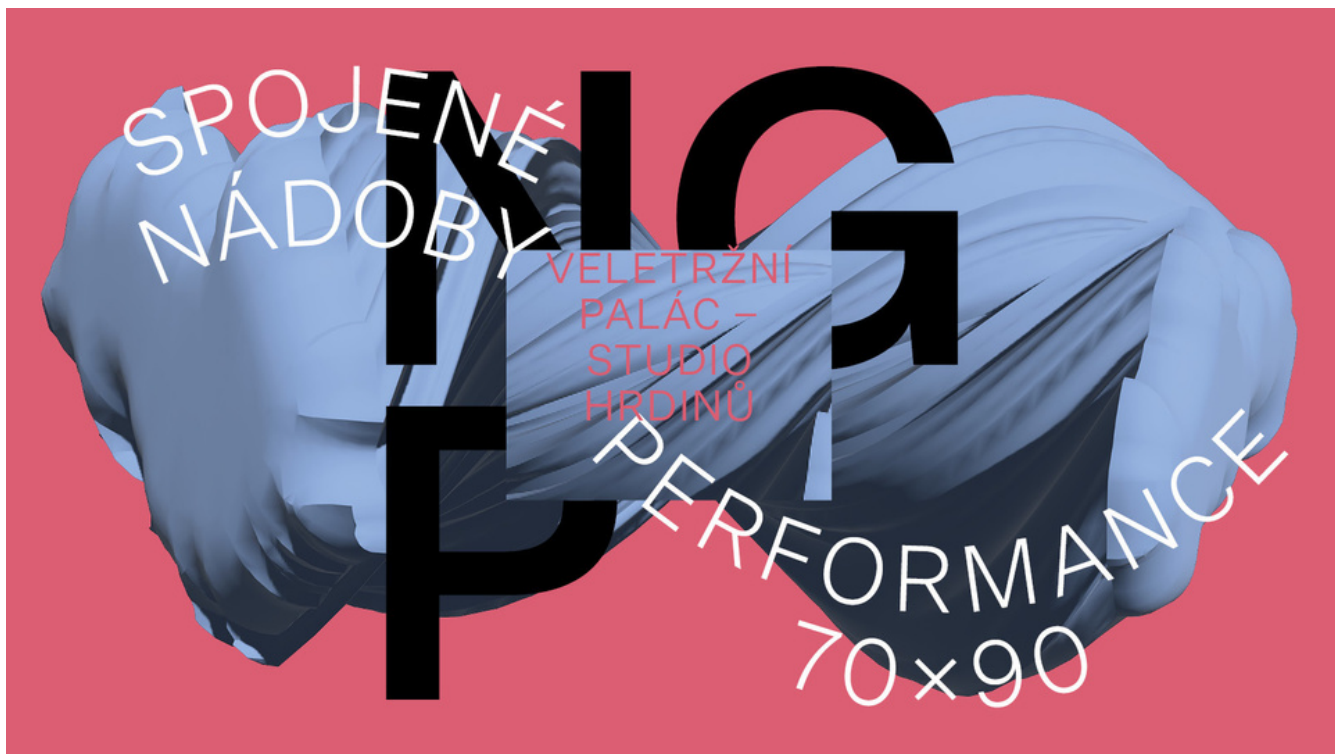
SPOJENÉ NÁDOBY 70x90

5.-6. 12. 2023 o 19:00 | Národní galerie Praha (Studio hrdinů, Veletržní palác)