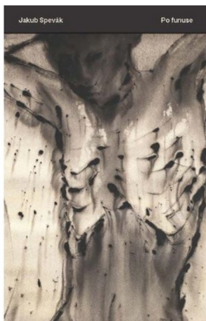
Po funuse