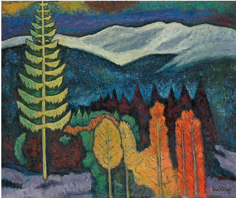
Foto: Janko Alexy, Jeseň v Tatrách, 100 x 120 cm, olej, 1942–1945

Janko Alexy bol všestranne kultúrne a spoločensky činný. Spolu s Milošom Alexandrom Bazovským a Zolom Palugyayom v rokoch 1930 – 1933 vytvorili tradíciu putovných výstav, v rámci ktorých popularizovali slovenské výtvarné umenie a v rokoch 1933 – 1937 sa Alexy pokúsil o založenie umeleckej kolónie v Piešťanoch. Zaoberal sa tiež výtvarnou kritikou a esejisticky spracovával životy slovenských umelcov, ktoré v roku 1948 vyšli pod titulom Osudy slovenských výtvarníkov . Spolu s prozaikom Gejzom Vámošom vydával od roku 1922 literárno-umelecký časopis Svojeť a v publicistike sa zameriaval hlavne na propagáciu slovenského výtvarného umenia. Navyše spolupracoval na vzniku a budovaní zbierkových fondov Vlastivedného múzea v Liptovskom Mikuláši a po vojne sa výrazne zaslúžil o záchranu a obnovu Bratislavského hradu, neskôr aj o rekonštrukciu Trenčianskeho a Spišského hradu.