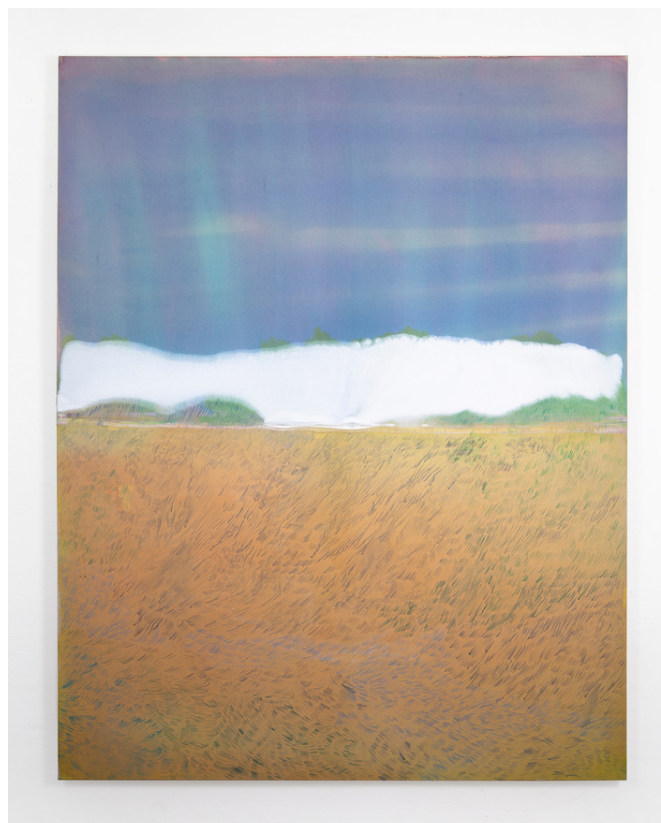
Foto: Žofia Dubová, Bez názvu (Vlna ), 180 x 140cm, akryl a tuš na plátne, 2022

12. 1. – 22. 2. 2024, vernisáž 11. 1. 2024 o 18:00 | Slovenský inštitút v Prahe, Hyberská 1