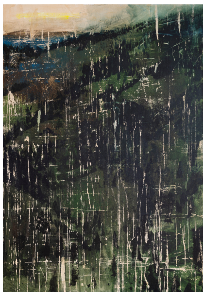
Rastislav Podoba - Večer v horách , šelak a akryl na plátně, 2023

Rovnako nimi vypovedá o usilovnosti, disciplíne a rutine, ktorá je ľuďom v tejto oblasti vlastná. Aj napriek všetkej prácnosti sú však jeho obrazy pozoruhodne pokojné. Akoby poľné krajiny ponúkali skrz svoje usporiadanie až akýsi duchovný zážitok. V neposlednom rade mu ide aj o poznanie všetkých zákutí jeho domoviny. A tak jeho pozornosť zaujali okrem iného remízky. Malé uzavreté svety, ktoré si naprieč nekonečnými lánmi sem a tam nájdú svoje miesto. Zatiaľ čo na poliach rastie všetko podľa striktné zabehnutých koľají (traktora), v remízkach to pripomína džungľu. Sú poliam tým najlepším protikladom. Poriadok tam človek nenájde. Často do nich nevedie ani žiadna cesta. O to viac to v nich ale žije. Sú útočiskom pre faunu aj flóru podobne ako pre človeka dedinský dom a prelínajú sa v nich všetky fázy života.