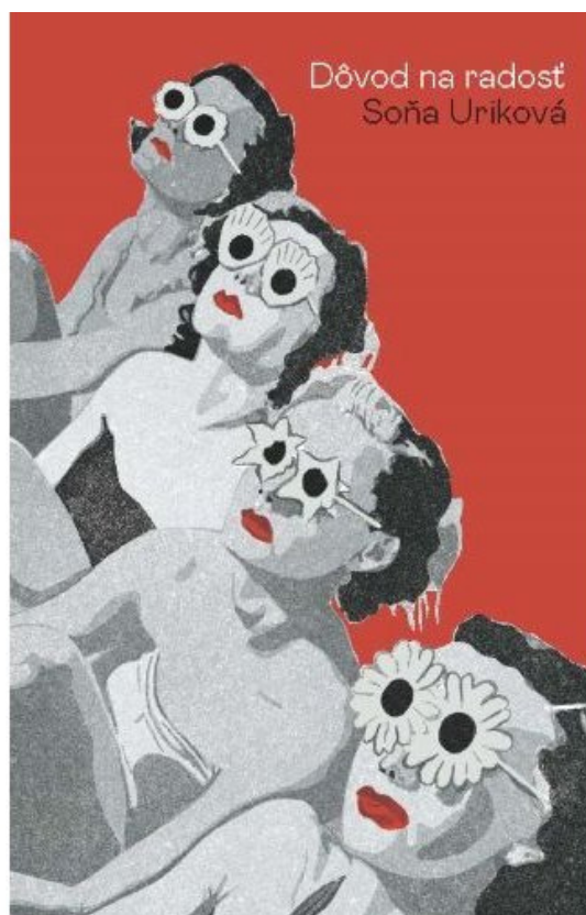
Obálka knihy Dôvod na radosť

Autorka v knihe poviedok načrtáva obrazy vzťahov medzi rodičmi a deťmi, starými rodičmi a vnúčatami, slimákmi a králikmi. Zaobíde sa bez veľkých gest a so zmyslom pre zápletku sa sústreďuje na detail, pretože to podstatné sa často ukrýva v zdanlivo nepodstatnom, nevypovedanom a nepomenovateľnom. Postavy hľadajú svoju ľudskú hodnotu napriek pocitu nedostatočnosti, vybočujú z preferovanej normy a ocitajú sa v rozporuplných životných situáciách. Dospievajúce dievčatá, mladé ženy bez jasnej perspektívy či pochybujúce matky: všetkým sa po istej životnej skúsenosti akosi zákonite odnechce.